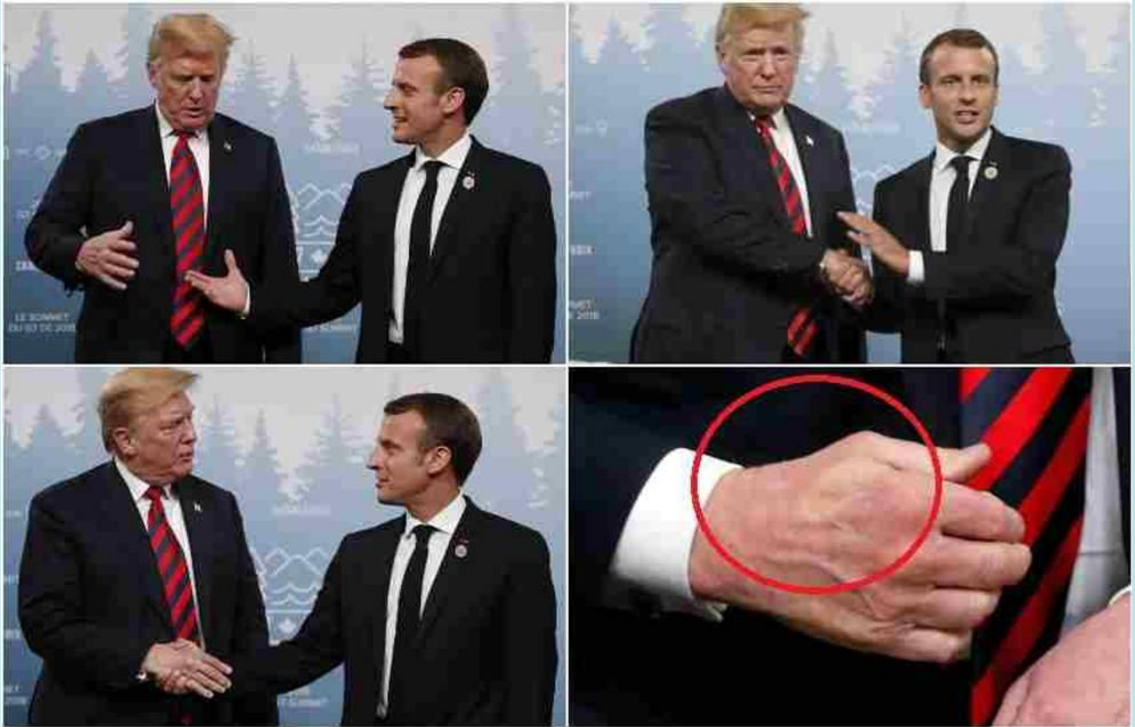
Macron a Parigi “ricambia con una contromossa”