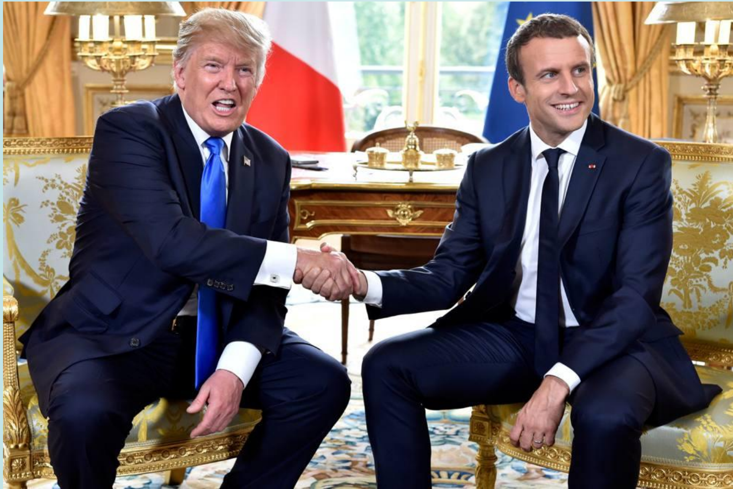
Trump nella stanza ovale usa la stretta di mano per «sottomettere» Macron.